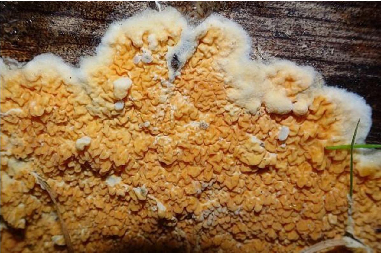
Dakloze huiszwam (ocharme toch!)